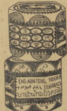
Dalem goetji ketjil merah dan poeti

Obat tjap Matjan tida boleh tida ada di toean poenja roemah, kerna tida ada obat lebih baek boeat semboehken Rheumatiek, sakit boekoe toelang dan spier, kasaleo dan pilek dari pada ini obat oemoem. Djoega boeat laen-laen penjakit dan ganggoean obat tjap Matjan ada mandjoer. Tjoba soeroe toean poenja boedjang beli boeat satalen satoe goetji ketjil Obat Matjan. Toean pasti aken dapet kafaedahan dari ini.